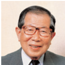
日野原 重明 先生 一般財団法人聖路加国際メディカルセンター理事長 一般財団法人ライフ・プランニングセンター理事長