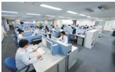
メディカルコールセンター

経験豊かな医師、保健師、看護師などを擁したティーペックの相談スタッフが、24時間・年中無休体制で電話によるご相談に応じています。健康・医療・介護・育児などに関するご相談にきめ細かくアドバイスいたします。