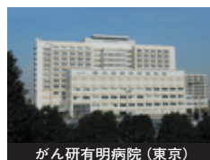
がん研有明病院(東京)